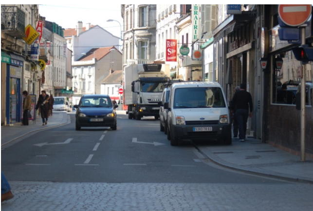
Rue Brettonnie : que reste-t-il pour les piétons ?

Il faut dire que pour un piéton (ou un cycliste) la circulation est particulièrement malaisée dans cette zone historiquement marquée par la présence des Anglais (Bretons) de la guerre de Cent Ans ( rue Porte-Brettonnie, rue Brettonnie et place Brettonnie)et traversée par le boulevard de Courtais. Et pourtant les commerces y abondent et les chalands aussi, par conséquent. Pour un promeneur ou quelqu'un qui veut y faire ses courses, les obstacles ne manquent pas : la traversée du boulevard de Courtais met déjà la patience à rude épreuve (près d'une minute souvent pour avoir le feu piéton au vert, et même alors il faut s'imposer face aux automobiles qui viennent de la rue Brettonnie), les trottoirs de la rue Brettonnie, déjà exigus, sont occupés par les terrasses de cafés, les étalages extérieurs de certains magasins, et les nombreuses automobiles qui profitent des bordures surbaissées pour y stationner (impunément), obligeant trop souvent les piétons à marcher sur la chaussée au milieu du flot des voitures.