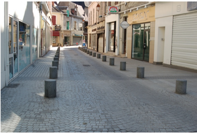
Un aménagement réussi rue Porte Saint-Pierre

Imaginons enfin que pour délester la circulation automobile sur le boulevard de Courtais, déjà trop dense à certaines heures et éviter les encombrements, on crée un « itinéraire-bis » pour traverser la ville en utilisant une voirie relativement peu fréquentée : rue des Grands prés, rue d'Alembert, rue Achille Allier, Avenue Jules Ferry... Ce qui ne préjuge pas de l'intérêt d'une réflexion sur un contournement plus large de Montluçon dans un avenir plus éloigné.