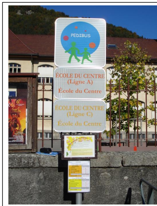
Le panneau du Pedibus devant l'école du Centre

Devant chaque école un grand poteau informatif indique parcours, horaires et l'un des panneaux intitulé « LES BONS POINTS DU PEDIBUS » résume les avantages de ce « mode de transport » sain, économique et non polluant