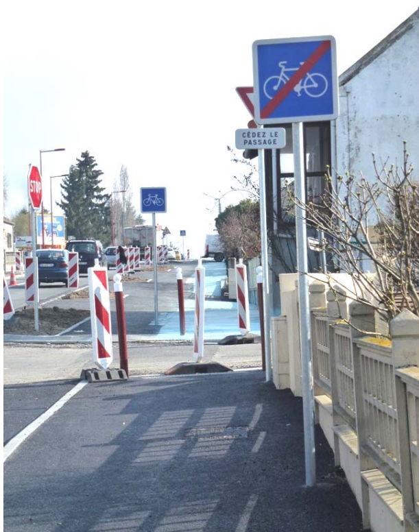
Vers Bel Air : piste à double sens ? Aménagements discontinus ? On attend la peinture au sol pour voir les résultats...

Que cette voie fasse l'objet d'un aménagement n'oubliant pas les usagers du vélo, ne peut qu'enchanter Cyclopède ! Bravo donc aux initiateurs de ce projet..